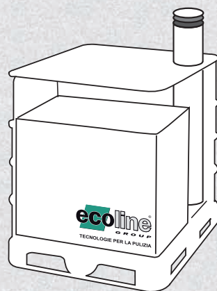
CONCORDE avio Hot ®